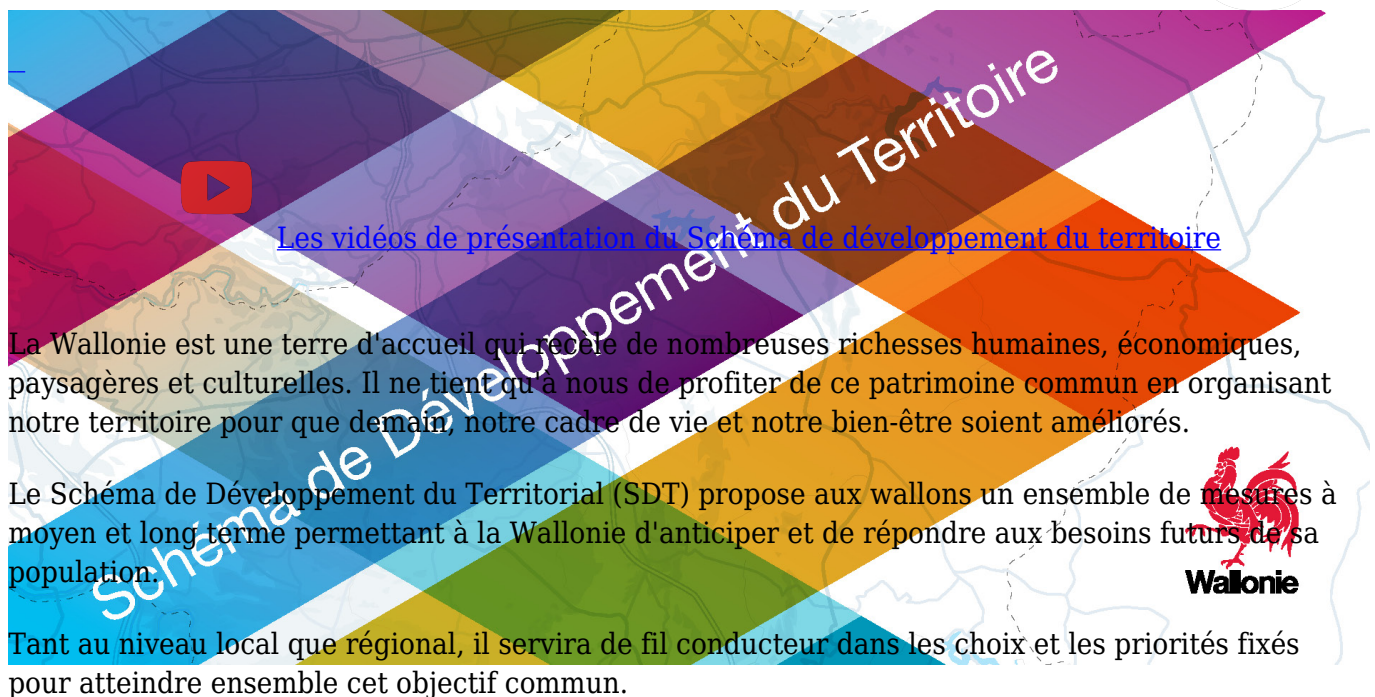
Schéma de Développement du Territoire (SDT)

L'élaboration de ce texte a fait appel à de nombreux intervenants, experts en matière d'aménagement du territoire. Aujourd'hui, ce travail est soumis à l'avis des citoyens wallons.