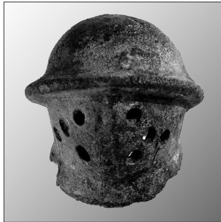
Casque miniature de Blandain.

Publié récemment, un ouvrage consacré aux objets votifs gallo-romains jette un éclairage nouveau sur cet objet (Kiernan, 2009, p. 76-78, fig. 3.21, iii). Se référant à une publication anglaise (Leahy, 1980), l'auteur commente un casque miniature, semblable à celui de Blandain, exhumé à Kirmington. D'une hauteur de 2,1 cm et pourvue d'une crête sommitale, sa face avant ne présente ici que deux perforations à hauteur des yeux. Comme celui de Blandain, il s'agit de la reproduction d'un casque de secutor . Cette pièce, qui n'appartient pas à une statuette, n'est pas considérée par Philippe Kiernan comme objet votif. Cet auteur, se basant sur d'autres études, y voit plutôt un souvenir vendu aux spectateurs qui assistaient à un combat de gladiateurs.