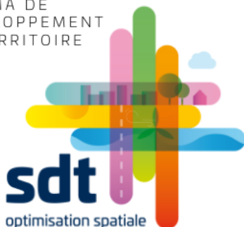
SCHÉMA DE DÉVELOPPEMENT DU TERRITOIRE