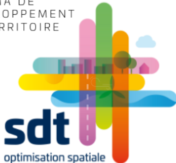
SCHÉMA DE DÉVELOPPEMENT DU TERRITOIRE